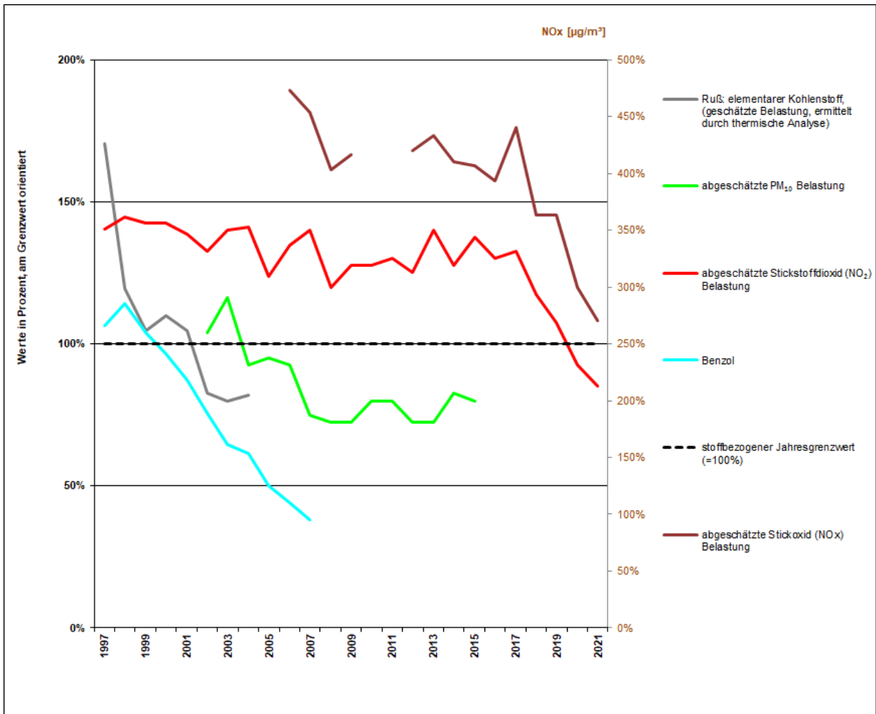
Abbildung 2: Prozentuale Entwicklung der Jahresmittelwerte für NO 2 , NO x , Ruß, PM 10 und Benzol am MP514